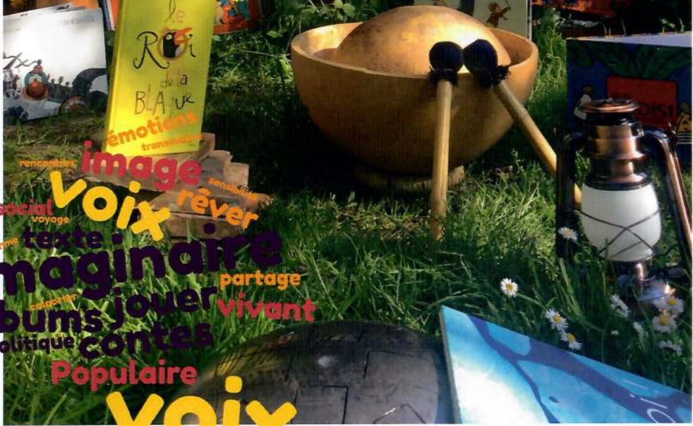
image social rythme texte imaginaires albums politique Populaire Voix réver partage vivant contes jouer